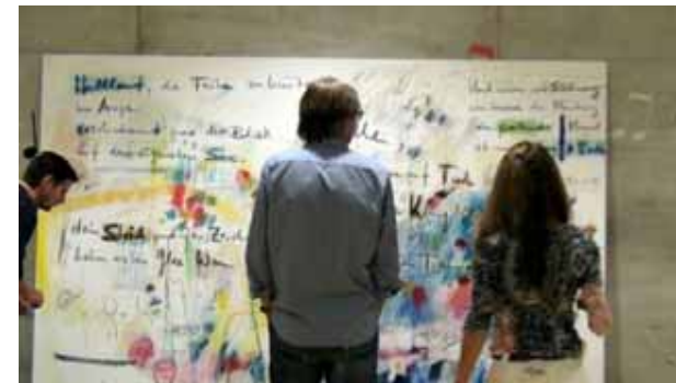
Videostills aus dem Video von Stephan Lichtensteiger